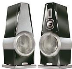
Quadral Aurum Lautsprecher