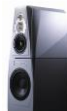
Adam Audio Tensor Lautsprecher-Serie