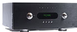
Primare Mehrkanal Vor- / Endverstärker