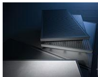
Fast Audio Design Absorber