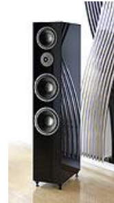
Nubert nuLine 122 in Klavierlack