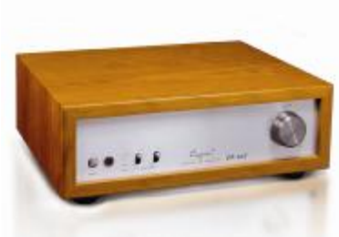
Cayin Audio Retro-Look Röhrenverstärker